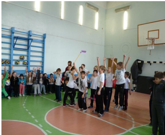
Наше строгое жюри