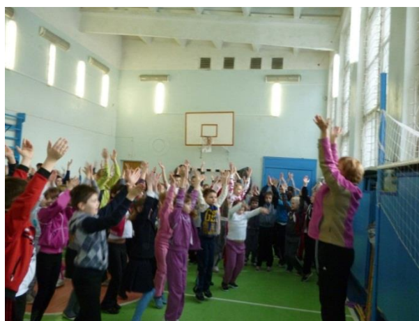
Сладкие призы всем участникам

Здоровый дух и хорошее настроение у всех!